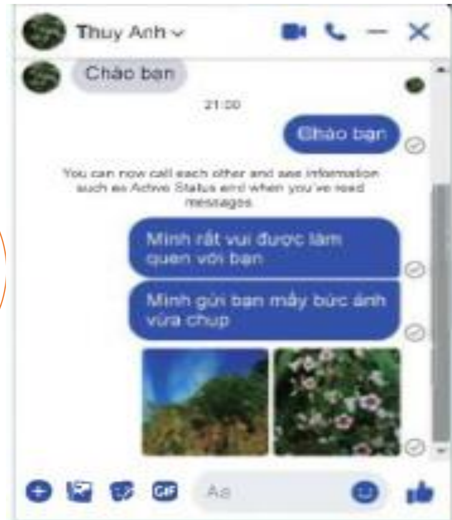
Hình 2. Ví dụ về gửi tin nhắn qua Messenger trên Facebook

Em hãy quan sát giáo viên thực hiện một số thao tác trên trang mạng xã hội và cho biết mạng xã hội đã giúp giáo viên làm những gì?