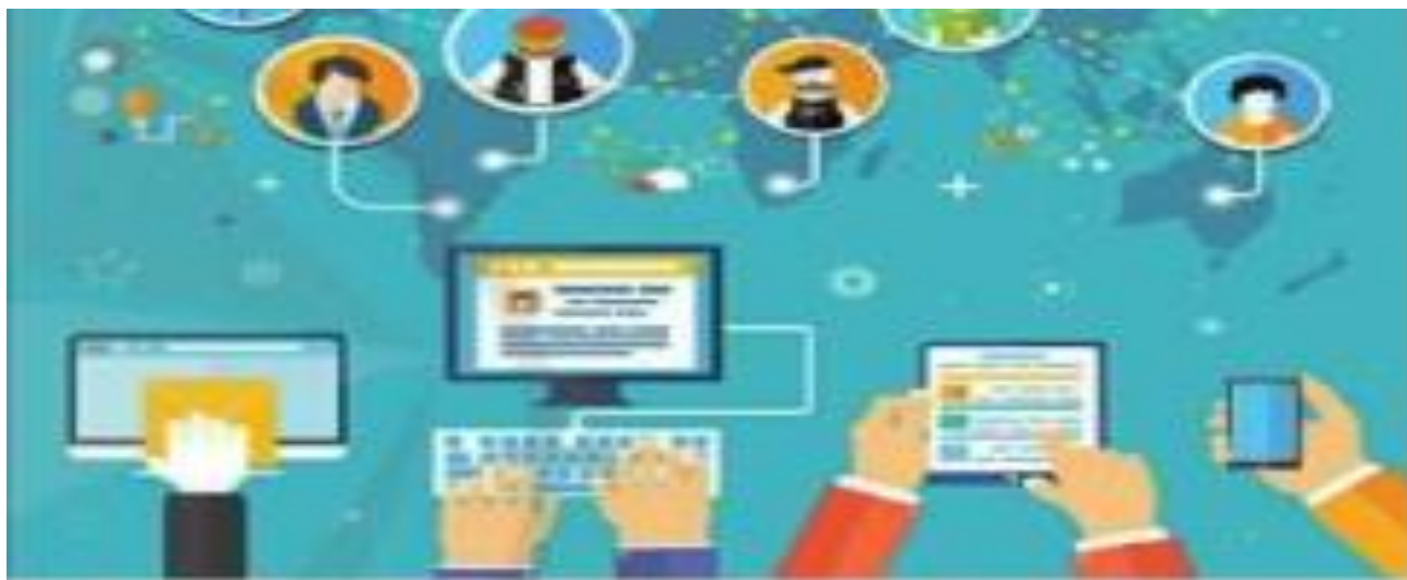
Hình 1. Hình ảnh mạng xã hội