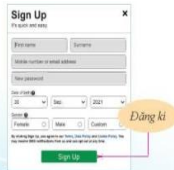
Hình 2. Cửa sổ đăng kí thông tin tài khoản Facebook