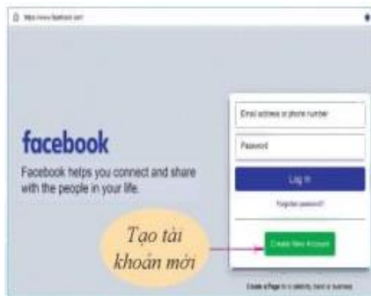
Hình 1. Giao diện trang chủ của Facebook